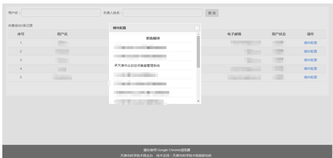
图 2-11 模块配置

2.在用户列表操作列中，法人用户选择“模块配置”链接，可以对个人用户授予系统访问权限。勾选对应的子系统，点击保存后该个人用户就有访问对应子系统的权限。