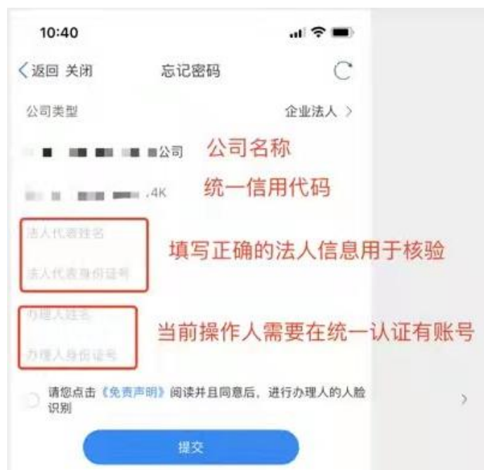
图 2-2 津心办 app 密码找回

3.账户注册成功后，请妥善保管用户名和密码，如在统一身份认证平台注册登录过程中遇到问题，请电话咨询 12345。