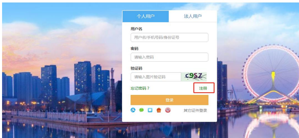
图 2-6 选择用户类型