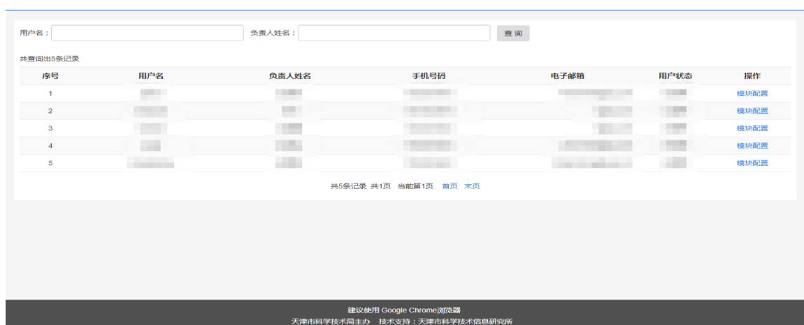
图 2-10 登录页面

1.法人用户需打开 http://kjgl.kxjs.tj.gov.cn/ 页面，点击“天津市统一身份认证平台”按钮，登录法人账号后，可以看到本单位全部个人用户的信息。