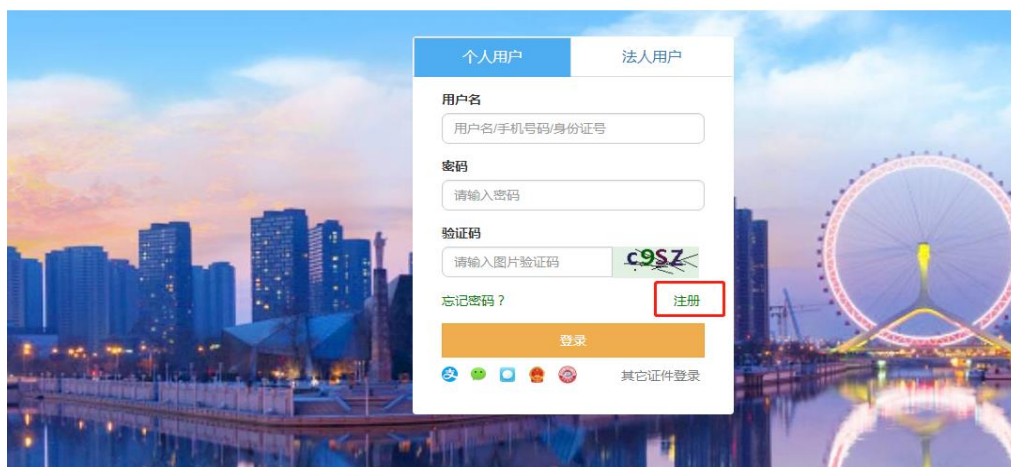
图 2-3 选择用户类型