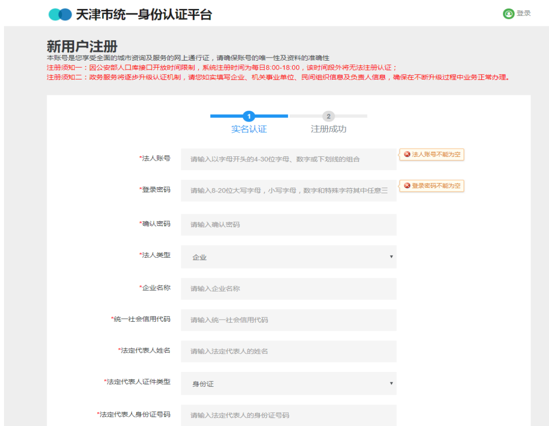
图 2-4 注册信息填写