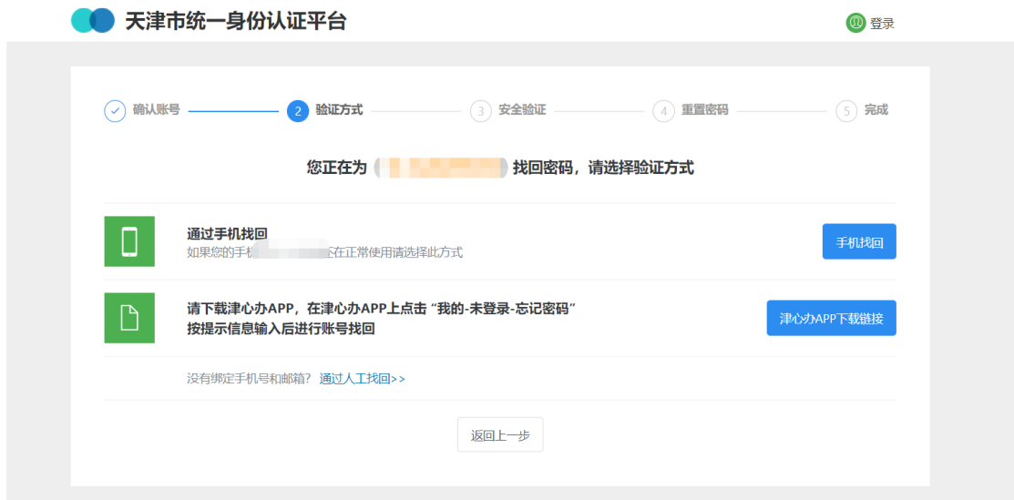
图 2-1 密码找回页面

(2) 如果注册手机号已不再使用, 可前往“津心办”APP, 在登录界面选择用户类型后依次点击“忘记密码”, “账号找回”, 根据系统提示进行操作。